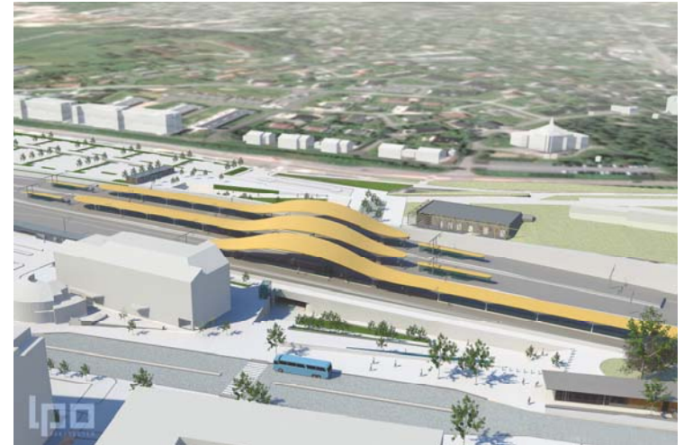
Nye Ski stasjon.