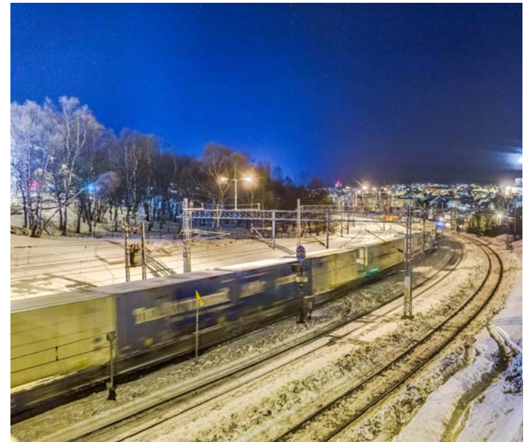
Et ARE-tog ankommer Narvik.